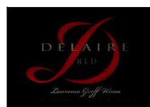
Delaire RED 82% Cabernet Sauvignon 8% Cabernet Franc 6% Petit Verdot 3% Malbec, 1% Merlot