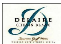
Chenin blanc 100% Chenin blanc