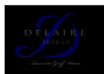
Shiraz 100% Shiraz