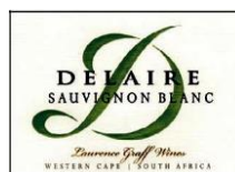
Sauvignon blanc 100% Sauvignon blanc