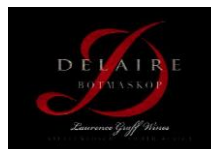
Botmaskop 69% Cabernet Sauvignon 13% Cabernet Franc 6% Merlot, 3% Malbec 9% Petit Verdot