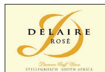
Rosé 100% Cabernet Franc