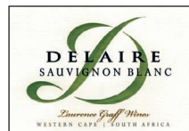
Sauvignon Blanc 100% Sauvignon Blanc