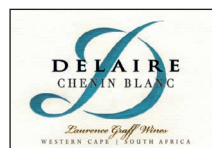
Chenin blanc 100% Chenin Blanc