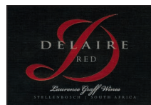
Delaire RED 82% Cabernet Sauvignon 8% Cabernet Franc 6% Petit Verdot 3% Malbec 1% Merlot