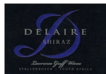
Shiraz 100% Shiraz